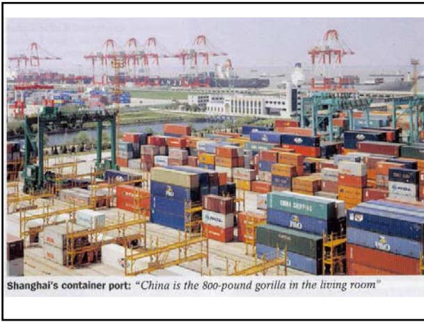
Shanghai's container port: "China is the 800-pound gorilla in the living room"