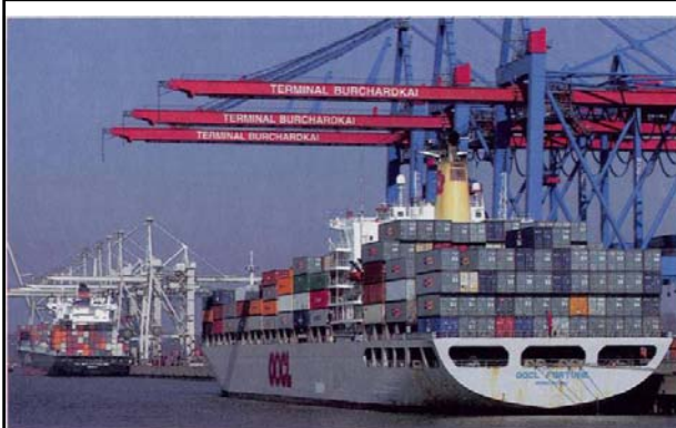
Containerschiffe im Hamburger Hafen: Als der Dollar fiel, bangten die Exporteure um ihr Geschäft