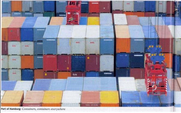
Port of Hamburg: Containers, containers everywhere

Today some 18 million containers are constantly crisscrossing the seven seas. These standardized receptacles have become the building blocks of the global village.