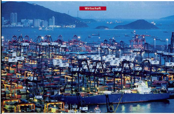
Container-Terminals in Hongkong: „Nicht in den wildesten Träumen mit so einem Wachstum gerechnet“