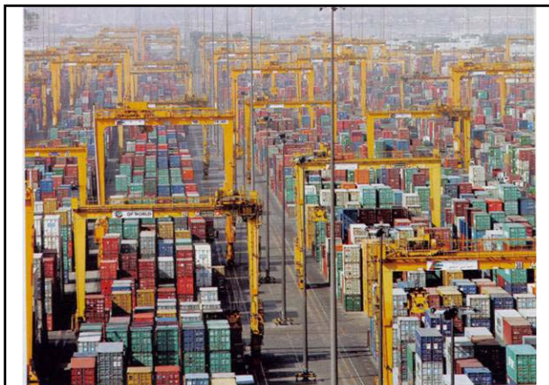
Dschabal Ali: Der größte von Menschenhand gebaute Hafen