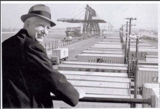
McLean: The man who changed the world