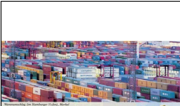
Warenumschlag (im Hamburger Hofen, Merkel)